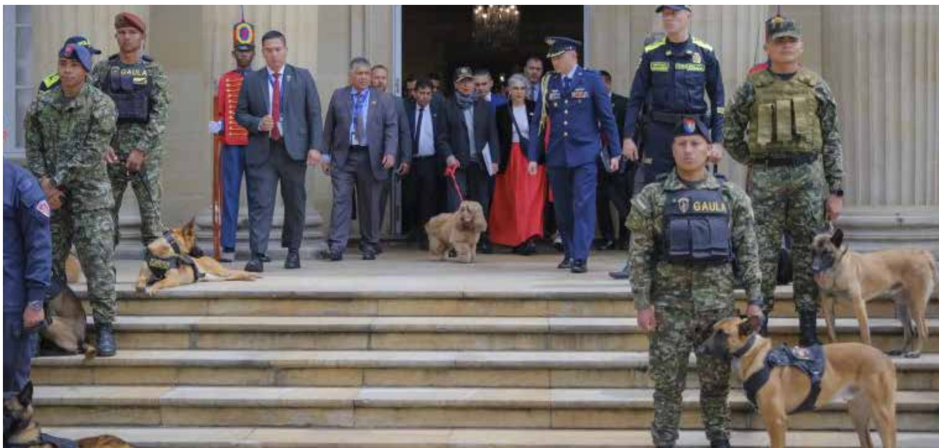
El presidente Petro llegó a promulgar Leyes en favor de los animales en compañía de su mascota.

El presidente Gustavo Petro Urrego promulgó hoy las leyes «Ángel» y «Lorenzo», dos normativas que marcan un hito en la protección de los animales en Colombia.