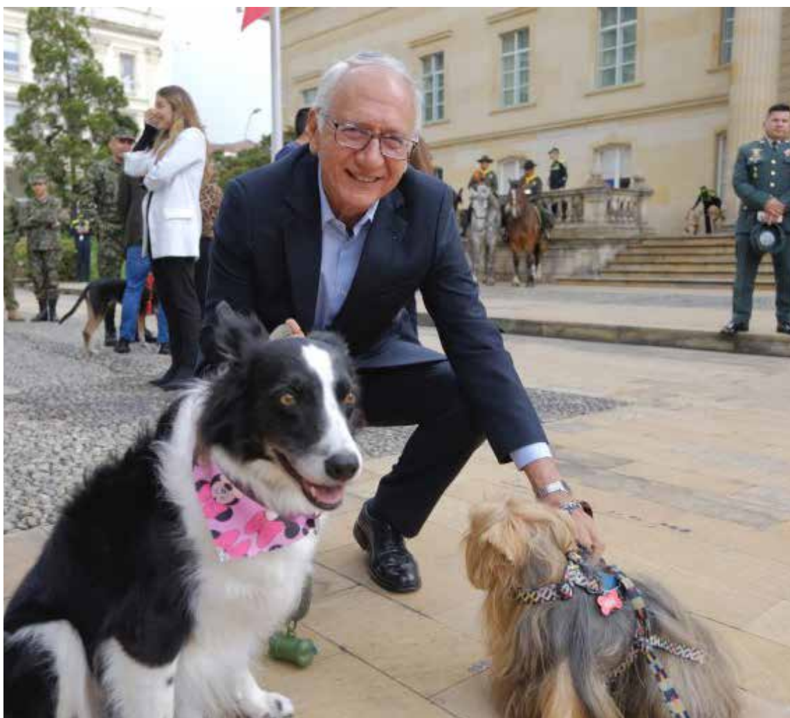
El ministro de Salud, Guillermo Jaramillo y sus dos mascotas.

La Ley Ángel, que actualiza el Estatuto Nacional de Protección de los Animales, endurece las penas por maltrato animal. Inspirada en el caso de Ángel, un perro víctima de crueldad extrema en Boyacá, la ley establece