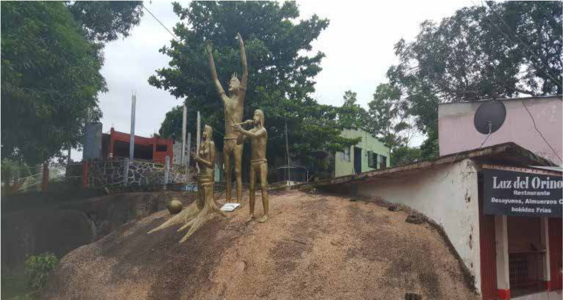
Bienvenida a los visitantes de Puerto Carreño.