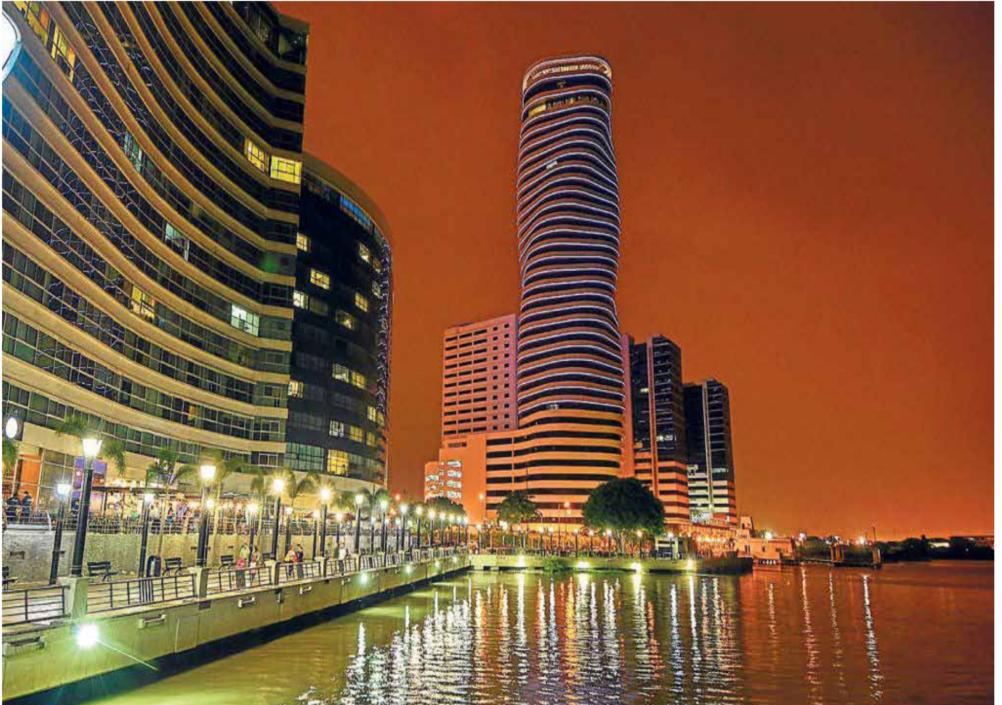
Guayaquil, destino turístico y gastronómico.

exquisita gastronomía, bares, supermercados, iglesias, hospital, estación de policía, ejército, y base naval, hacen parte de la tranquilidad en estas playas aptas para la recreación o, simplemente para broncearse en una silla de sol, mientras se lee un libro con el sonido de las olas y se disfruta un coco helado para refrescarse. Los más avezados, sobre la carretera y saliendo del complejo turístico, encontrarán olas gigantes para practicar surf.