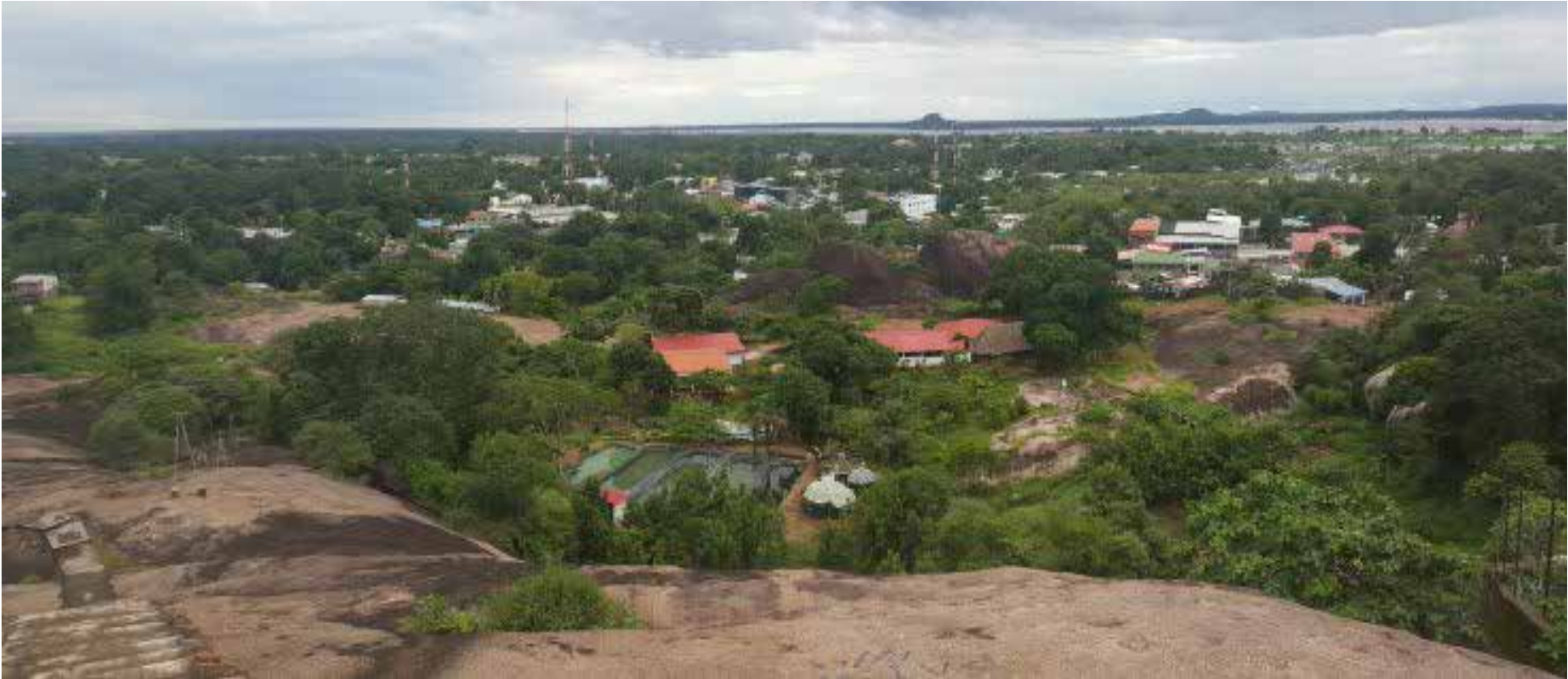
Puerto Carreño, una ciudad acogedora