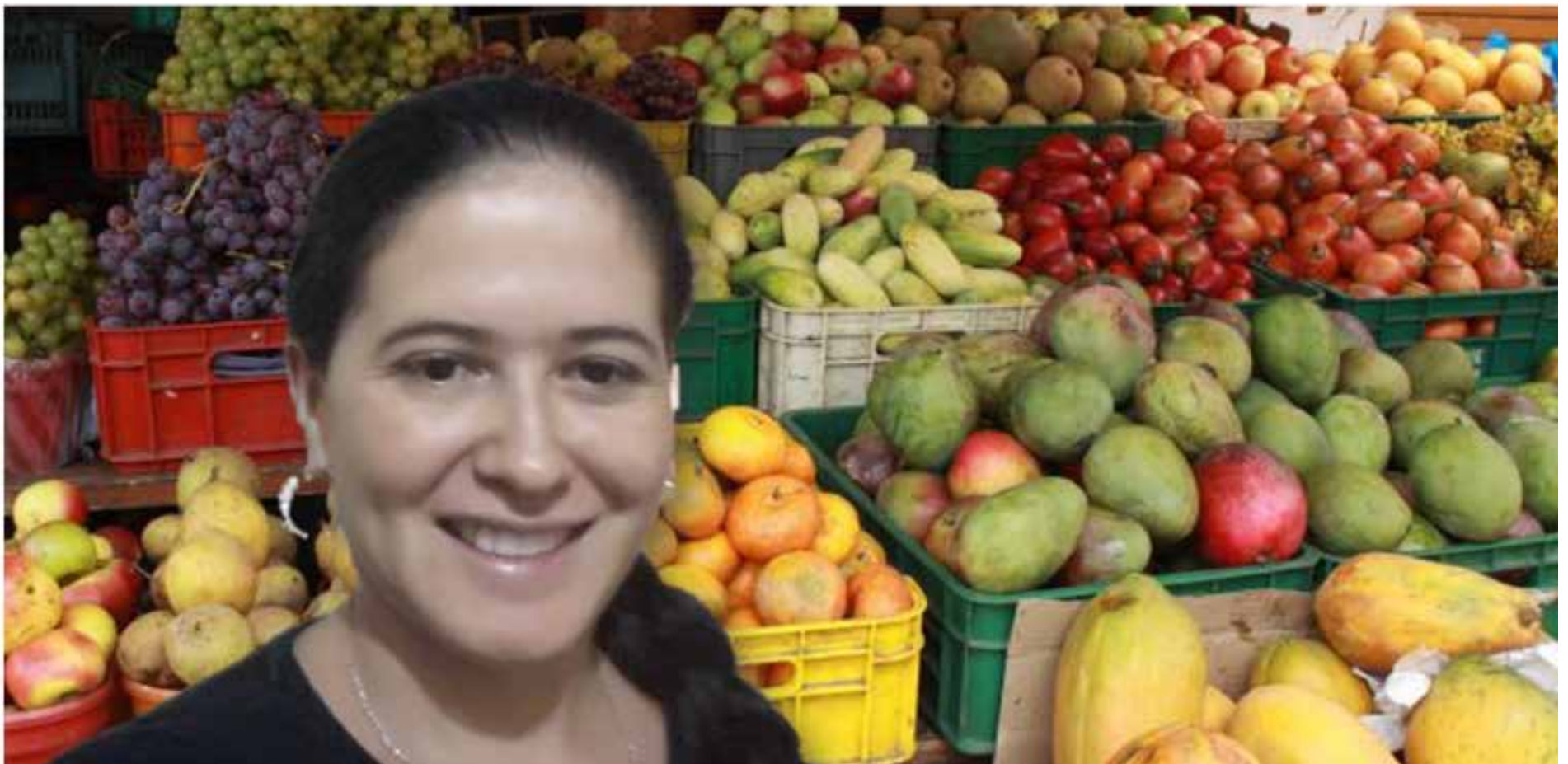
Mantenga una limpieza extrema con frutas y verduras