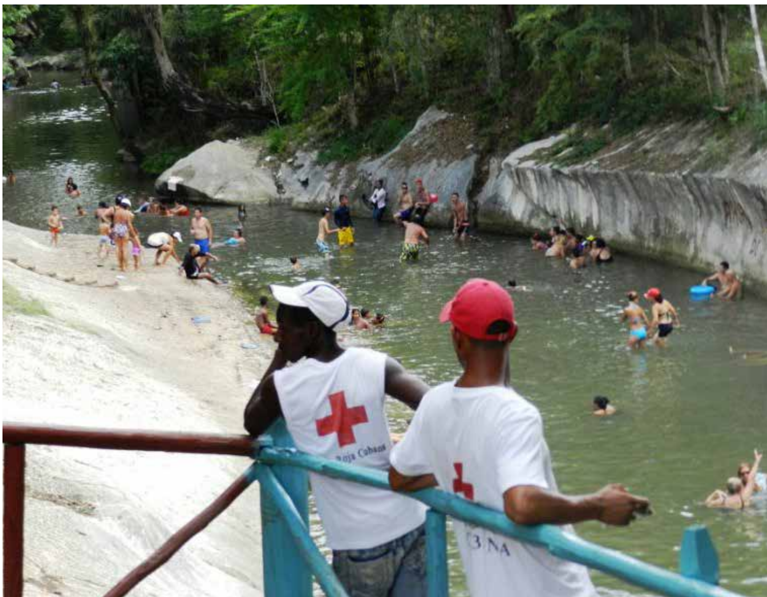
Cangilones del Río Máximo, al noroeste de la ciudad cubana de Camagüey

La Base de Campismo Popular —instalada en ese hermoso paisaje— dispone solidas cabañas para descansar, convivir