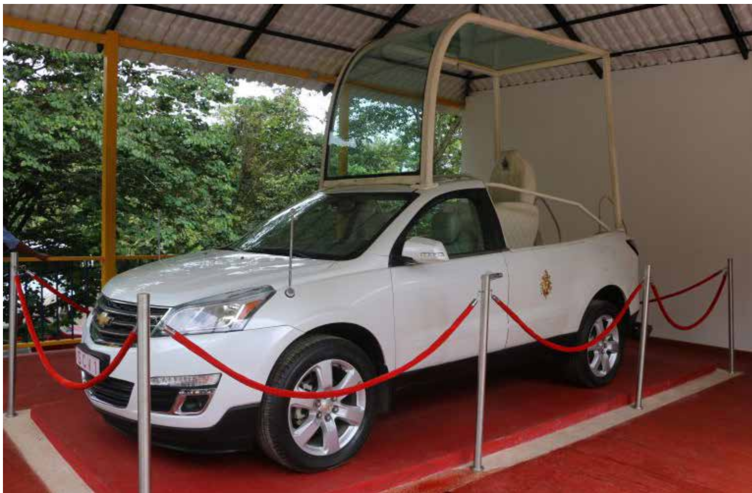
El papamóvil que transportó al Sumo Pontífice durante su visita a Colombia en 2017.

E n la entrada del Agroparque Sabio Mutis, un espacio de encuentro entre la naturaleza y el conocimiento, yace la Plazoleta de la Paz, un homenaje a la trascendencia y el legado del Papa Francisco. Concebida por el padre Harold Castilla Devos, cjm, Rector de UNIMINUTO, esta plazoleta resguarda un tesoro invaluable: el papamóvil que transportó al Sumo Pontífice durante su visita a Colombia en 2017.