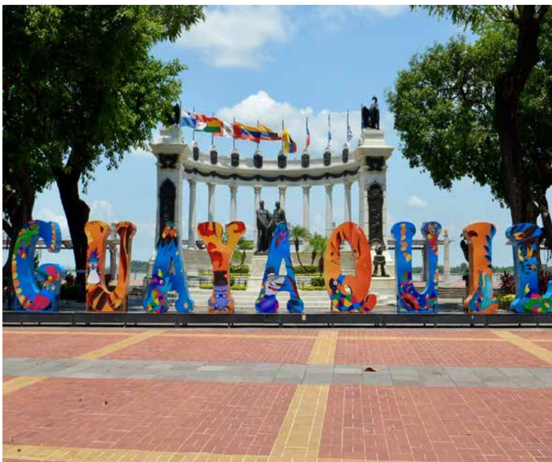
Tras una pandemia que la desnudó ante el mundo hace seis meses, la ciudad ecuatoriana de Guayaquil intenta renacer en su Bicentenario de Independencia.

Para despedir este recorrido, es importante decir que el Malecón 2000 tiene una extensión de 2.5 kilómetros en donde se concentran grandes monumentos de la historia de Guayaquil, como el