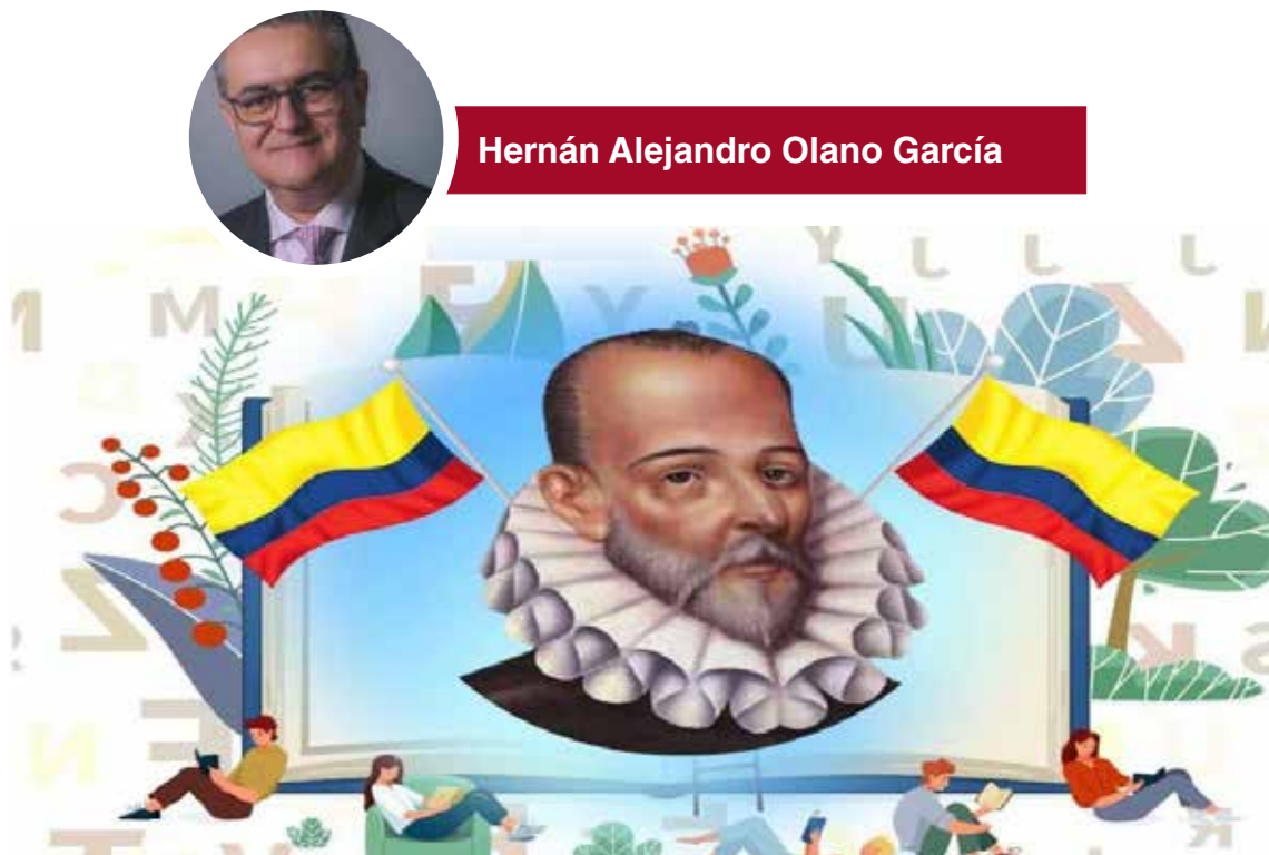
Día del Idioma

El 23 de abril, es también el día del bibliotecario, declarado por la Asociación Colombiana de Bibliotecarios en su XXX reunión realizada en 1958; es igualmente el día del libro en castellano, declarado así en el marco de la UNESCO por las delegaciones de los países de habla española y por el Centro Regional para el Fomento del Libro