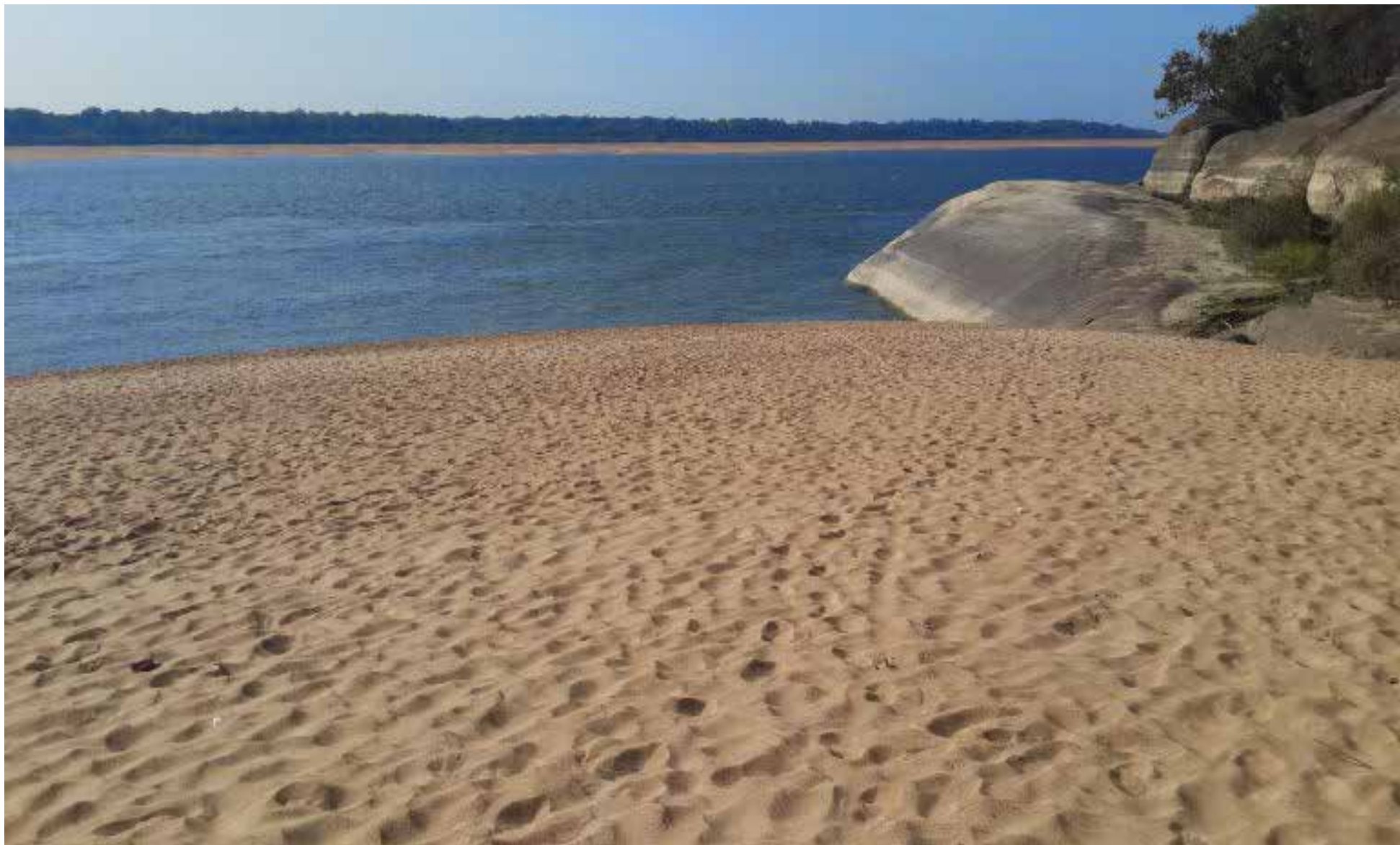
Puerto Carreño, es paso del imponente río Orinoco

P uerto Carreño, la capital del departamento de Vichada, se presenta como un destino con un creciente atractivo turístico gracias a su rica biodiversidad y paisajes naturales únicos en la Orinoquía colombiana. Sin embargo, la región también enfrenta desafíos en materia de orden público, ambiente y seguridad.